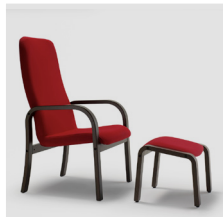
Reclinabile di 25°