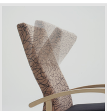
Poggia testa reclinabile