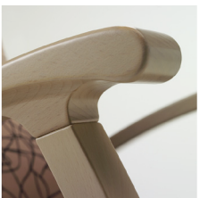
Braccioli a presa facilitata