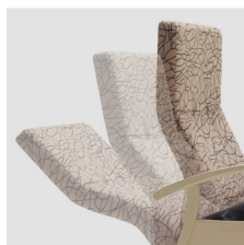
Schienale reclinabile di 170°